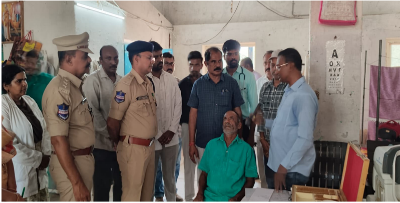
వరంగల్ జిల్లా బ్యూరో ఏప్రిల్ 09, మీడియా టుడే.

వరంగల్ సెంట్రల్ జైల్, నర్సంపేట సబ్ జైల్లో ఖైదీలు -సిబ్బందికి వైద్య పరీక్షలు