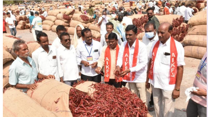
వరంగల్ జిల్లా బ్యూరో ఏప్రిల్ 09, మీడియా టుడే.

ఎనుమాముల మార్కెట్ను సందర్శించిన ఏఐకేఎఫ్ ప్రతినిధి బృందం