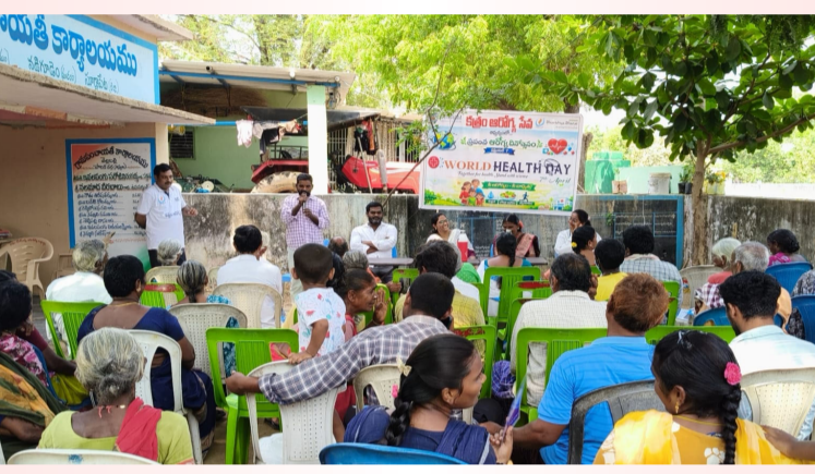
నడిగూడెం, ఏప్రిల్ 9 (మీడియా టుడే):-

సూర్యపేట జిల్లా నడిగూడెం మండలం తెల్లబల్లి గ్రామం లో క్రతం ఆరోగ్య ఆధ్వర్యంలో ఉచిత మెగా క్యాంప్ నిర్వహించారు. ఈ శిబిరంలో అరవై మందికి ఆరోగ్య సమస్యలు ఉన్న గ్రామ ప్రజలకు ఉచిత మందులు పంపిణీ చేశారు. మరియు ఉచితంగా రక్త పరీక్షలు నిర్వహించారు. ఈ శిబిరం తెల్లబల్లి గ్రామంలో నిర్వహించడం పదవసారి అని వైద్యులు అన్నారు. ఈ కార్యక్రమంలో గ్రామకార్యదర్శి, సర్పంచ్ ఉపసర్పంచ్, వార్డ్ సభ్యులు మరియు గ్రామ ప్రజలు పాల్గొన్నారు.