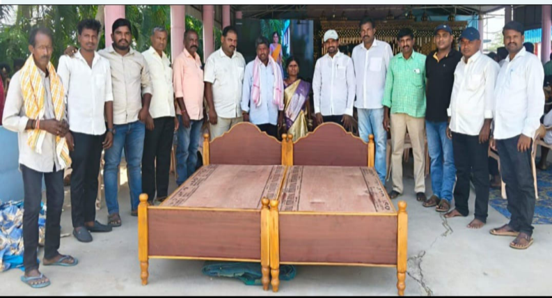
రాజన్న సిరిసిల్ల జిల్లా స్టాప్ రిపోర్టర్ : మీడియా టుడే, ఏప్రిల్ 09 :