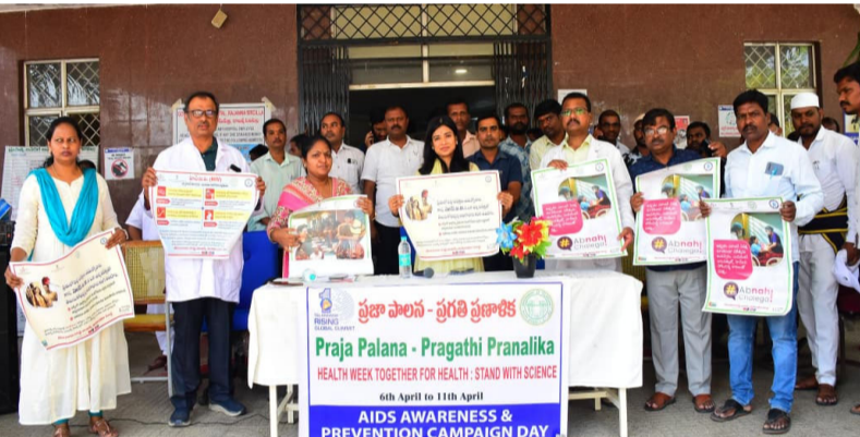
రాజన్న సిరిసిల్ల జిల్లా స్టాప్ రిపోర్టర్ : మీడియా టుడే , ఏప్రిల్ 09

రాజన్న సిరిసిల్ల జిల్లా కేంద్రంలో ఎయిడ్స్ నియంత్రణపై అవగాహన ర్యాలీ