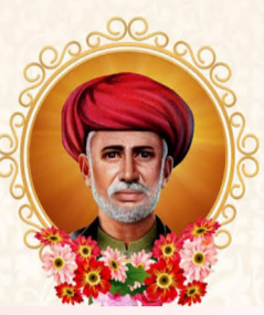
కోదాడ ఏప్రిల్ 9 మీడియా టుడే:-