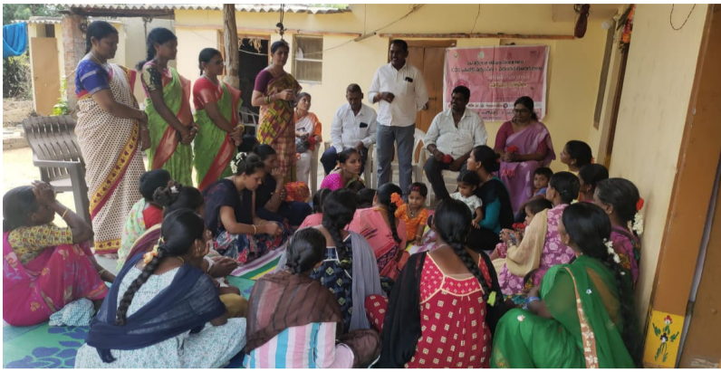
పరంగల్ జిల్లా బ్యూరో, ఏప్రిల్ 09, మీడియా టుడే.

పిల్లల పోషణ, పరిశుభ్రతపై తల్లులకు అవగాహన