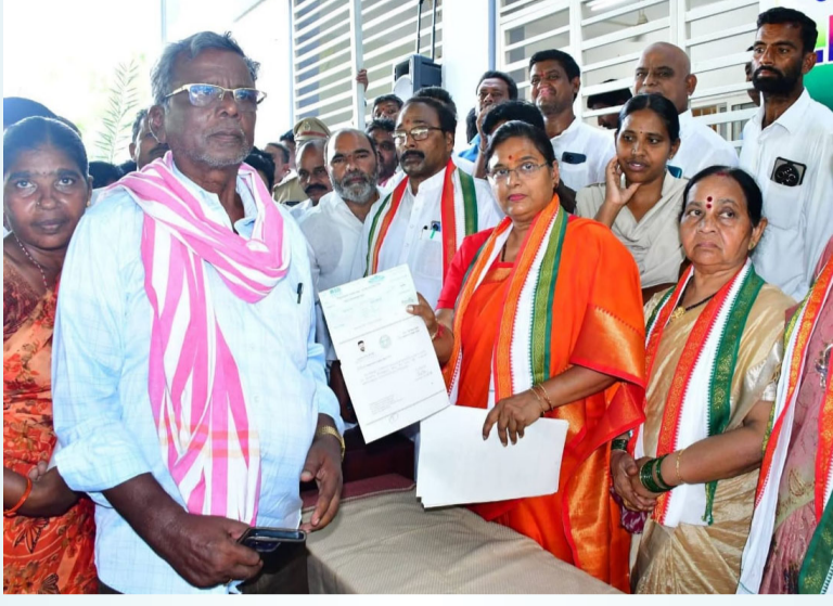
కోదాడ, ఏప్రిల్ 09 (మీడియా టుడే)-: