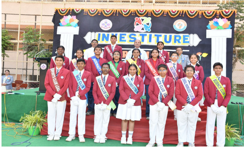
ఉప్పల్, ఏప్రిల్ 08 (మీడియా టుడే ప్రతినధి): ఉప్పల్ లోని లిటిల్ ఫ్లవర్ పాఠశాలలో విద్యార్థి నాయకుల ప్రమాణ స్వీకారోత్సవం ఘనంగా నిర్వహించారు. పాఠశాల ప్రధానోపాధ్యాయులు

విద్యార్థుల్లో నాయకత్వ వికాసానికి ప్రోత్సాహం - బ్యాడ్మింటన్, సాఫ్ట్ బాల్, క్రీడా క్రీడల్లో సత్కారం