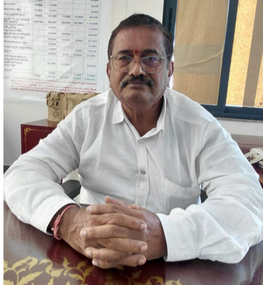
రాజన్న సిరిసిల్ల జిల్లా స్టాప్ రిపోర్టర్

మీడియా టుడే , ఏప్రిల్ 08 : రాష్ట్ర ప్రభుత్వం ప్రతిష్టాత్మకంగా అమలు చేస్తున్న ఇందిరమ్మ ఇండ్లు 40 శాతం పూర్తి చేసి.. రాజన్న సిరిసిల్ల జిల్లా రాష్ట్రంలో ప్రథమ స్థానంలో నిలిచింది. ఆత్మగౌరవ ప్రతీక సాకారం దిశగా ఇండ్ల నిర్మాణ పనులు శరవేగంగా సాగుతున్నాయి. లబ్ధిదారులకు ప్రజా ప్రభుత్వం ఇసుక ఉచితంగా అందిస్తోంది. ఇండ్లు పూర్తి చేసుకుంటున్న వారి బ్యాంకు ఖాతాల్లో ఇప్పటిదాకా రూ. 161 కోట్లకుపైగా ఆర్థిక సహాయం జమ చేసి.. రాష్ట్ర ప్రభుత్వం భరోసాగా నిలుస్తున్నది. పండుగ వాతావరణంలో గృహ ప్రవేశాల వేడుకలు సాగుతున్నాయి. సొంత ఇల్లు నిర్మించుకోవాలని ప్రతి ఒక్కరి చిరకాల స్వప్నం. ఆ కల సాకారానికి ప్రజా ప్రభుత్వం ఇందిరమ్మ ఇండ్ల పథకానికి రూపకల్పన చేసింది. ఇండ్ల నిర్మాణానికి రూ. ఐదు లక్షల ఆర్థిక సహాయాన్ని నాలుగు విడుదలల్లో అందజేస్తుంది. 400 చదరపు అడుగుల నుంచి 600 చదరపు అడుగులలోపు ఇంటి నిర్మాణం చేసుకోవాలి ఉంటుంది. 4 దశల్లో గ్రీన్ చానల్ ద్వారా ఆర్థిక సహాయం అందుతుంది. బేస్మెంట్ నిర్మాణం పూర్తైన తర్వాత లక్ష రూపాయలు, గోడలు నిర్మిస్తే లక్ష రూపాయలు, స్లాబ్ నిర్మించిన తరువాత 2 లక్షల రూపాయలు ఇంటి నిర్మాణం పూర్తయిన తర్వాత మరో లక్ష రూపాయలు నేరుగా లబ్ధిదారుల బ్యాంకు ఖాతాల్లో జమ అవుతాయి.