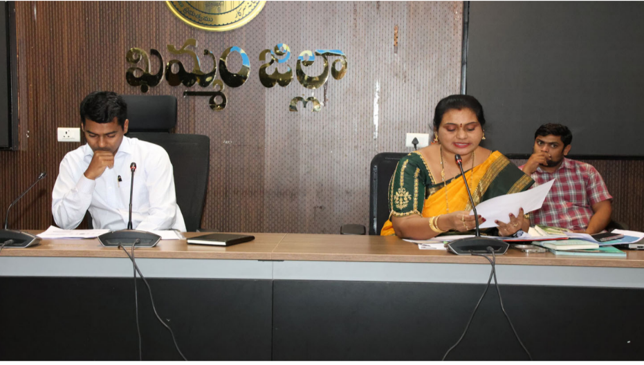
మీడియా టుడే ఖమ్మం ప్రతినిధి :

అంగన్వాడీల పని తీరుపై సంబంధిత అధికారులతో సమీక్షించిన జిల్లా కలెక్టర్.