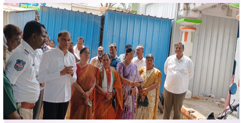
కోదాడ, మార్చి 24 (మీడియా టుడే):-

ఏర్పాట్లను పరిశీలించిన మున్సిపల్ చైర్ పర్సన్, వైస్ చైర్ పర్సన్, ఆలయ ధర్మకర్తలు