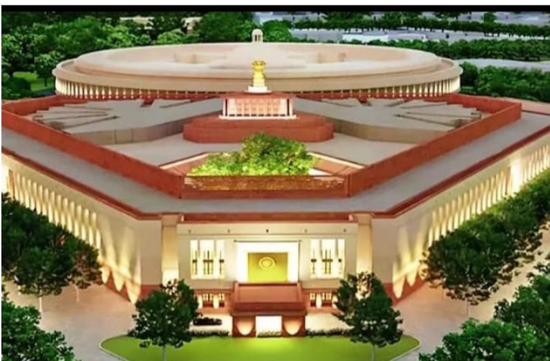
నెలకొండపల్లి మార్చి 24 మీడియా టుడే

లోక్ సభ, అసెంబ్లీ స్థానాలు 50 శాతం పెంపు కోసం కేంద్ర ప్రభుత్వం ప్రయత్నిస్తుంది. లోక్ సభ, అసెంబ్లీ స్థానాలను 50 శాతం పెంచాలని కేంద్ర ప్రభుత్వం కీలక నిర్ణయం తీసుకుంది. ఈ బిల్లును ఈ పార్లమెంట్ సమావేశాల్లోనే ప్రవేశపెట్టనున్నట్లు సమాచారం. దీని ప్రకారం పార్లమెంట్ స్థానాలు 543 నుంచి 816కి చేరుతాయి. అన్ని