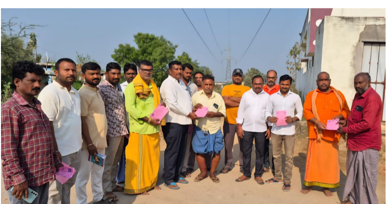
రాయికల్-మీడియా టుడే-మార్చి 24: