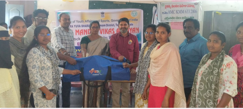
మీడియా టుడే మధిర:

పలు మండలాల్లో యువతకు వికాస్ అభియాన్ గురించి అవగాహన