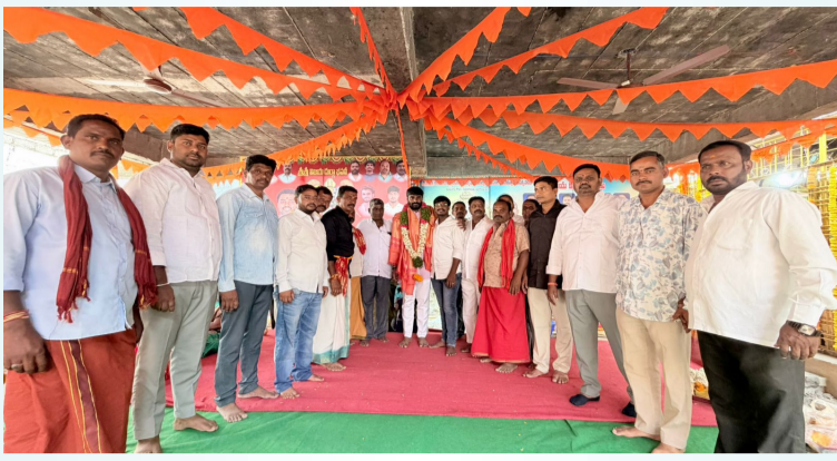
శేరిలింగంపల్లి మీడియా టుడే స్యూస్ మార్చి 22: