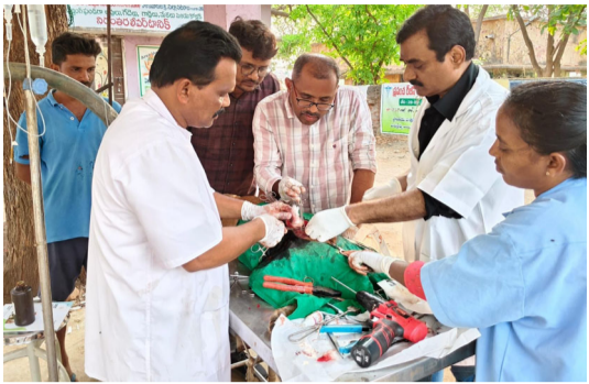
కోదాడ, మార్చి 22 (మీడియా టుడే):-