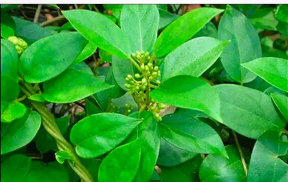
పొడపత్రి ఆకులను షుగర్ ఉన్నవారికి వరంగా చెప్పవచ్చు. ఈ ఆకులను

పొడపత్రి ఆకుల్లో యాంటీ ఫాటిగ్ గుణాలు సమృద్ధిగా ఉంటాయి. అందువల్ల ఈ ఆకులను తింటే ఎంతటి నీరసం, అలసట అయినా త్వరగా తగ్గిపోతాయి. మళ్లీ చురుగ్గా మారుతారు. ఉత్సాహంగా పనిచేస్తారు. యాక్టివ్ గా ఉంటారు. పొడపత్రి ఆకుల్లో స్యూగర్ ప్రొటెక్టివ్ గుణాలు ఉంటాయి. కనుక ఈ ఆకులను తింటే నరాల బలహీనత తగ్గుతుంది. నాడీ మండల వ్యవస్థ ఆరోగ్యంగా ఉంటుంది.