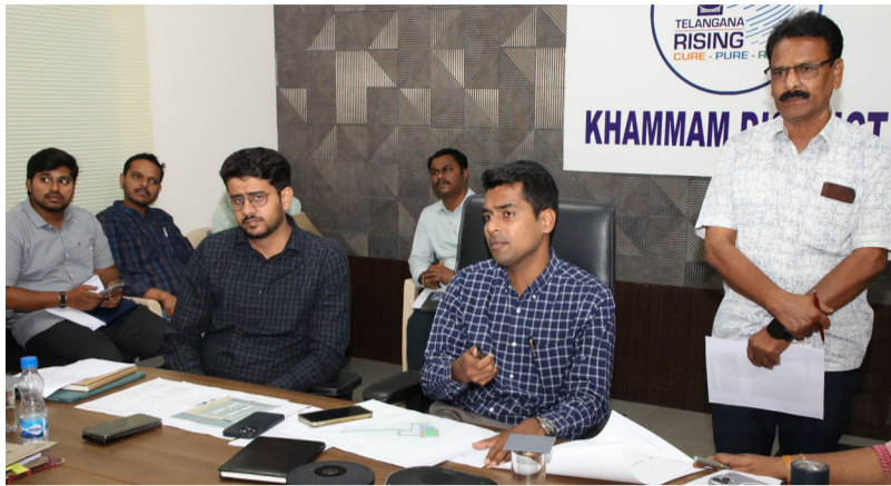
మీడియా టుడే ఖమ్మం ప్రతినిధి :

-తెలంగాణ పబ్లిక్ స్కూల్ లపై సంబంధిత అధికారులతో సమీక్షించిన జిల్లా కలెక్టర్.