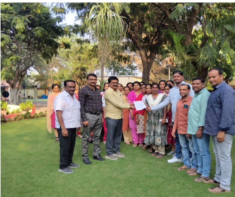
మందమరి మార్చి 17