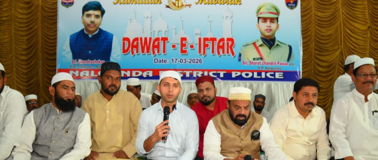
జగిత్యాల మీడియా టుడే- మార్చి 17 : తెలంగాణ రాష్ట్ర ప్రభుత్వం