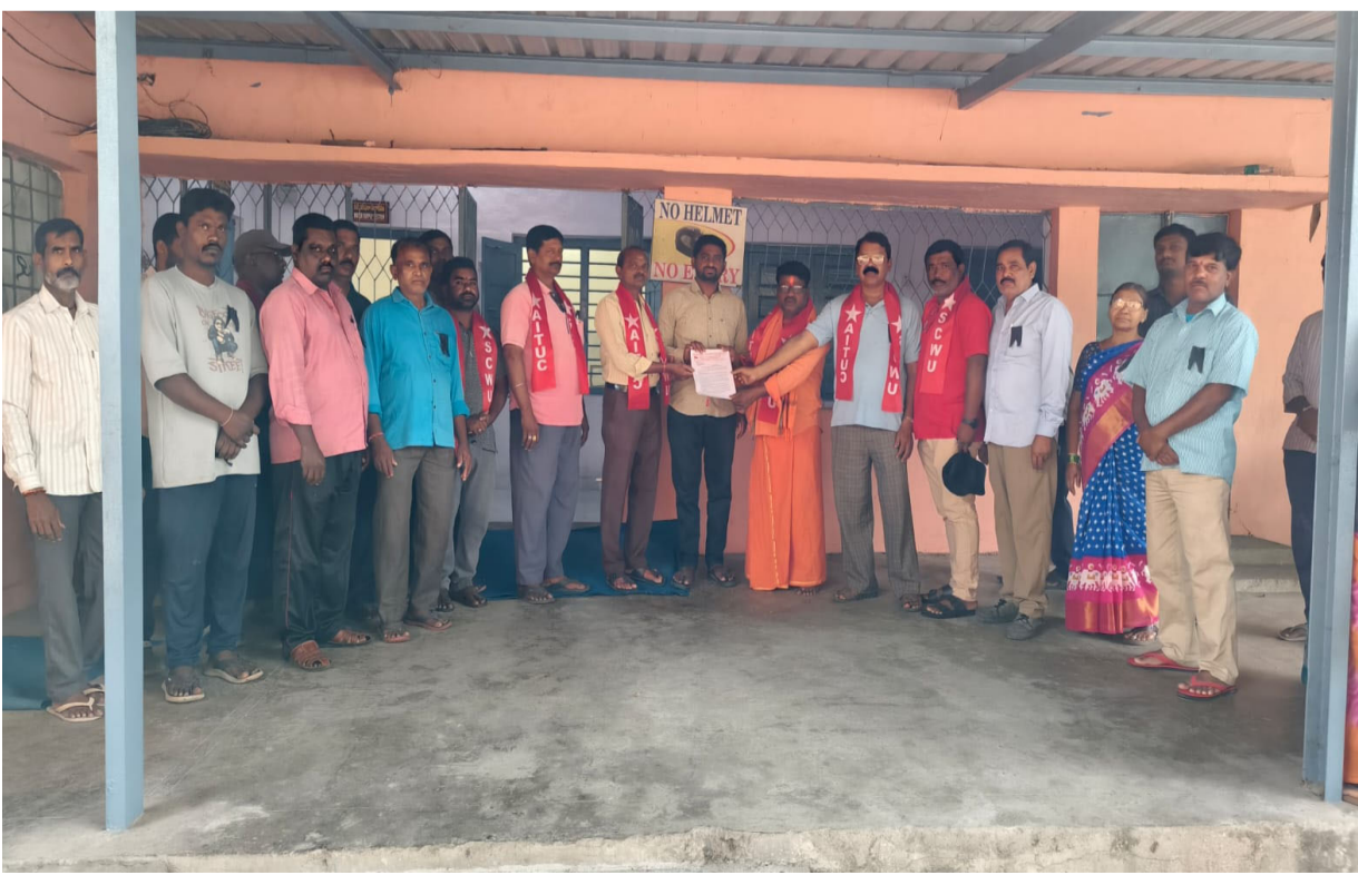
మందమరి మార్చి 17