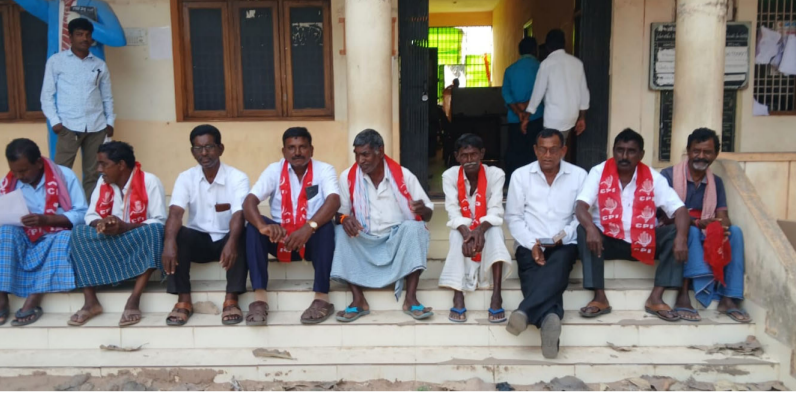
( మీడియా టుడే గరిడేపల్లి మార్చి 17 )