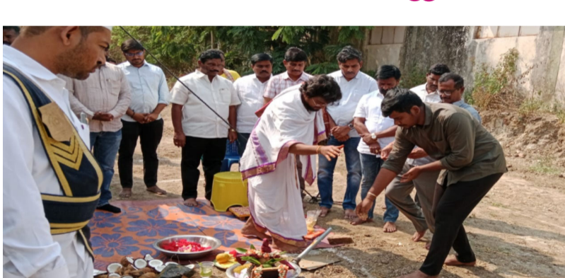
భద్రాచలం, మార్చి 17 (మీడియా టుడే):