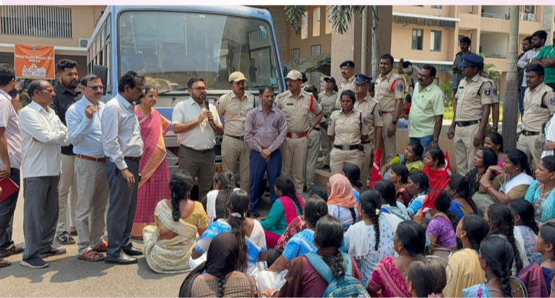
మీడియా టుడే/మేడ్చల్ మల్లజిగిరి జిల్లా: మార్చి 17

మేడ్చల్ మల్లజిగిరి జిల్లాలోని ఆశావర్షం సమస్యలను తప్పకుండా పరిశీలించి వారికి పరిష్కారం అందిస్తామని అదనపు కలెక్టర్ పైజాన్ అహ్మద్ అన్నారు. మంగళవారం జిల్లా కలెక్టరేట్ లో నిరసన తెలుపుతున్న ఆశావర్షం సమస్యలను అడిగి తెలుసుకొని జిల్లా స్థాయిలో పరిష్కరించే సమస్యలను కలెక్టర్ దృష్టికి తీసుకుపోయి పరిష్కరిస్తామని అన్నారు. జిల్లాలో పరిష్కారం కాని సమస్యలను ప్రభుత్వం దృష్టికి తీసుకెళ్లి ప్రత్యేక చొరవతో పరిష్కరించే దిశగా ప్రయత్నిస్తామని తెలిపారు. జిల్లా వైద్య ఆరోగ్య శాఖాధికారి తో మీ సమస్యలను చర్చించి నియమ నిబంధనల అనుగుణంగా పరిష్కరిస్తామని తెలిపారు. మీరు ఏ సమస్యలను తన దృష్టికి తీసుకురావాలని తన తప్పకుండా మీ సమస్యలను పరిష్కరిస్తామని అదనపు కలెక్టర్ సూచించారు. అదనపు కలెక్టర్ సానుకూలంగా స్పందించారని ఆశావర్షం సంక్షేమం వ్యక్తం చేసి తమ సమస్యల, డిమాండ్ లను తెలియజేస్తూ దరఖాస్తును అదనపు కలెక్టర్ కు అందజేశారు.