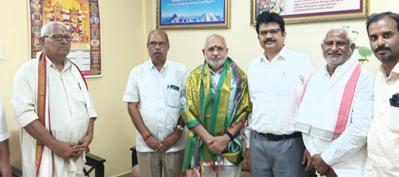
మీడియా టుడే మధ్య: తెలంగాణ తిరుపతిగా ప్రసిద్ధిగాంచిన జమలాపురం శ్రీ వెంకటేశ్వర స్వామి