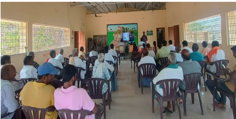
జగిత్యాల రూరల్, మార్చి 17:

రైతులకు కిట్లు, సాయిల్ హెల్త్ కార్డుల పంపిణీ