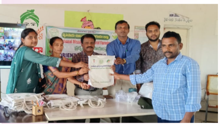
భద్రాచలం, మార్చి 17 (మీడియా టుడే):