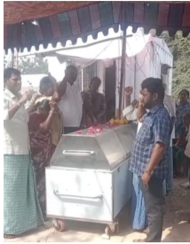
వలిగొండ మార్చి 17 మీడియా టుడే