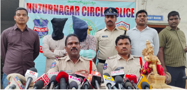
(మీడియా టుడే గరిడేపల్లి)

సీ. నెంబర్.37/2026 యూ /ఎన్ 331(4),305 బిఎన్ఎస్ ఆఫ్ పీఎస్ గరిడేపల్లి గరిడేపల్లి, మట్టంపల్లి పియస్ పరిధిలో ఆంజనేయస్వామి పంచలోహ విగ్రహాన్ని దోగతనశీ చేసిన విషయం ఈ రోజు ఉదయం 06-00 గంటల సమయంలో గరిడేపల్లి ఎస్సై తన సిబ్బందితో గరిడేపల్లి గ్రామం