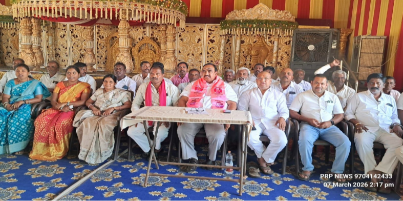
కరీంనగర్ జిల్లా స్టాఫ్ రిపోర్టర్ : మీడియా టుడే , మార్చి 07 :