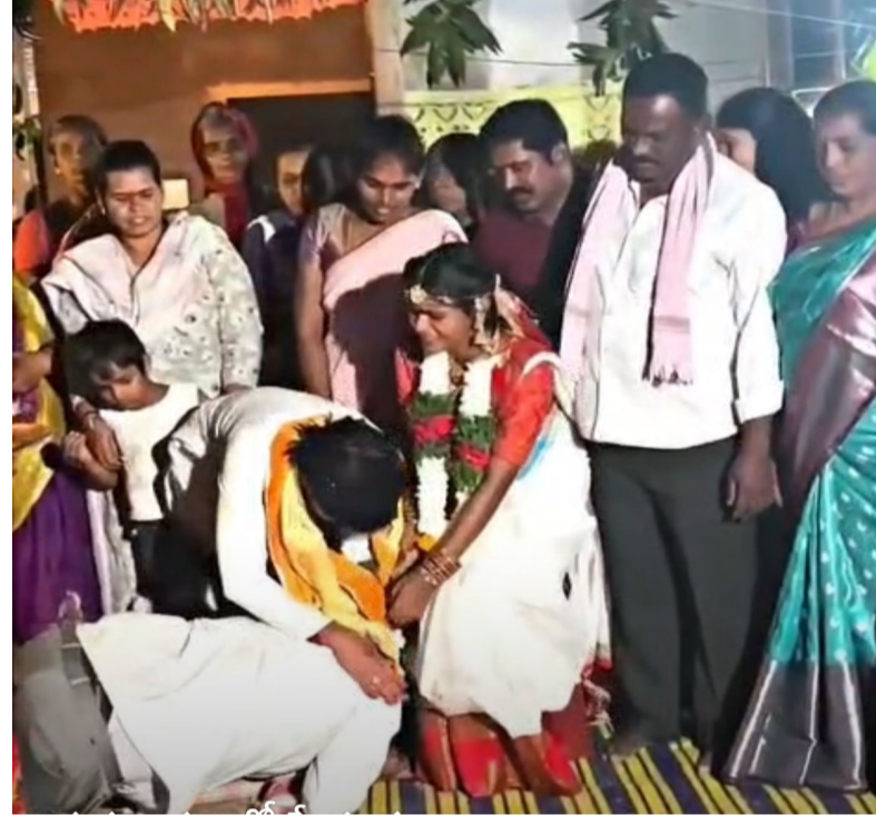
మనసులో నుంచి వస్తున్న మాటలు కేవలం అభిప్రాయం మాత్రమే ఎవర్ని ఉద్దేశించి కాదు ఇంకొకరిగా కాదు ఈ మీడియా చూడగానే ఇలా స్పందించాలని అనిపించింది. అంతే దయచేసి మరోలా అనుకోవద్దు

రోజూ చిన్న చిన్న విషయాలకే కోప్పడే తండ్రి, ఆ కోపం వెనుక దాగి ఉన్న ప్రేమ పెళ్లి రోజు కట్టలు తెంచుకుని కన్నీళ్లుగా బయటపడుతుంది. నిన్నటిదాకా చేతి పట్టుకుని నడిపిన కూతురు కోసం, ఈ రోజు పరిచయం లేని చిన్న వయసు అల్లుడి కాళ్ళు పట్టుకుంటాడు తండ్రి. మనతో సమాన వయసున్న విద్యార్థులకి ముందు కాదా, తన పరువు, ప్రతిష్ఠ, గౌరవం అన్నీ పక్కన పెట్టి చేతులు పట్టుకుని బ్రతిమలాడతాడు కాళ్ళు పట్టుకుని మరియు వేడుకుంటాడు"నా బిడ్డను చక్కగా చూసుకోండి" అని వేడుకుంటాడు. ప్రతి మనిషికి గౌరవం ఉంటుంది.. పౌరుషం ఉంటుంది. ఆత్మాభిమానం ఉంటుంది.కానీ కూతురు సుఖం ముందు అవన్నీ మోసమవుతాయి. ముక్కు ముఖం తెలియని వాళ్ళ కాళ్ళపై పడటం బలహీనత కాదు.తండ్రి ప్రేమ యొక్క అత్యున్నత రూపం. కూతురు పెళ్లి అంటే ఆభరణాలు కాదు.అప్పగింత.ప్రాణం పెట్టి పెంచిన జీవితాన్ని విశ్వాసంతో ఇంకో ఇంటికి అప్పగించటం. కాళ్ళు పట్టుకున్నది ఆడబిడ్డ తండ్రి కాదు. ఆ తండ్రి గుండె.ఎంతైనా మగపిల్ల తల్లిదండ్రులు అదృష్టవంతులు ఆడపిల్ల కోడలు రూపంలో వాళ్ళకి జీవితాంతం సేవలు చేయటానికి మంచి చెడులు చూడటానికి మరియు భార్యతలు నిర్వృతచటానికి వాళ్ళ నంతాన అభివృద్ధి కోసం వాళ్ళతోనే 80 సంవత్సరాలు ఉంటుంది వాటితో పాటు కట్నాలు కానుకలు ఇవన్నీ సాంప్రదాయంగా వచ్చేవైనా తీసుకొస్తూనే మంచిగా ఉంటూనే ఉంటుంది అదే కన్న తల్లిదండ్రుల దగ్గర మాత్రం కేవలం పెళ్ళయ్యే వరకు సుమారు 20 సంవత్సరాలు ఉంటుంది అబ్బా ఎంత అదృష్టవంతులు అండి మగపిల్లల ను కన్న తల్లిదండ్రులు అని ఒక్కొక్కసారి అనిపిస్తూ ఉంటుంది . దయచేసి మరోలా అనుకోకండి ఇది