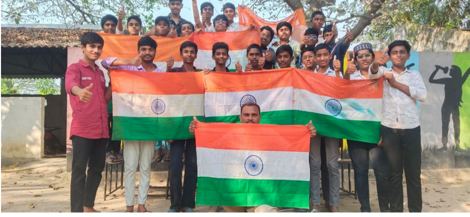
కోదాడ, మార్చి 07 (మీడియా టుడే)-:

నేడు జరగబోయే భారత్, న్యూజిలాండ్ క్రికెట్ ప్రపంచకప్ ఫైనల్ మ్యాచ్ ఆకాంక్షించారు.