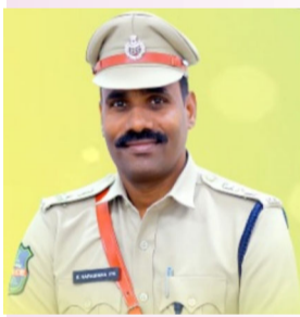
మీడియా టుడే మార్చి 07 సూర్యాపేట :-