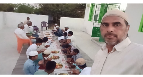
రాజన్న సిరిసిల్ల జిల్లా స్టాప్ రిపోర్టర్.మీడియా టుడే : మార్చి 07: