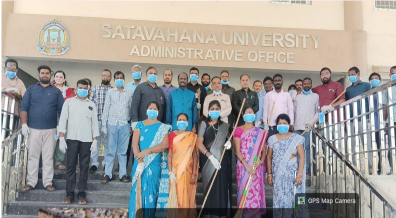
కరీంనగర్ జిల్లా స్టాఫ్ రిపోర్టర్: మీడియా టుడే, మార్చి 07: