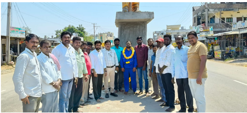
( మీడియా టుడే గౌరవార్థం )