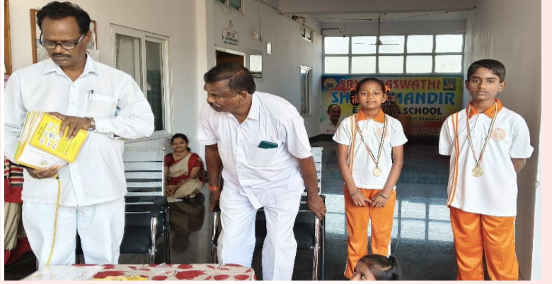
కరీంనగర్ జిల్లా స్టాఫ్ రిపోర్టర్ : మీడియా టుడే , మార్చి 07 :