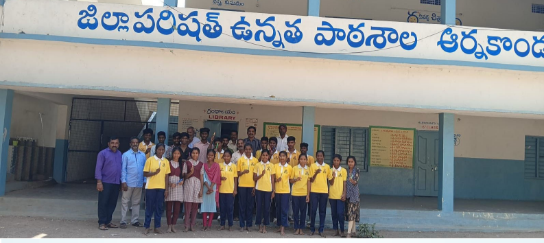
జిల్లాపరిషత్ ఉన్నత పాఠశాల ఆర్వకాండ